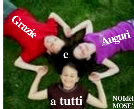
a tutti NOI del MOSE!

Grazie alla vita che mi ha dato tanto Mi ha dato il sorriso e mi ha dato il pianto Così io distingo bacio da cuore infranto i due materiali che formano il mio canto e il canto di tutti che è il mio stesso canto Grazie alla vita che mi ha dato tanto!