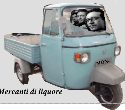
I Mercanti di liquore

su e giù con l'Apecar, la vita è tutta qua