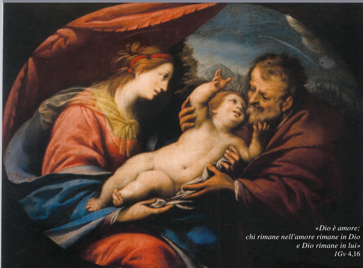
Patrimonio artistico della Città di Monza Riccardo Taurini 'Sacra famiglia' 1645 circa